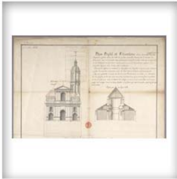
Plan, profil et élévation d'une nouvelle cathédrale à Québec, par Gaspard-Joseph Chaussegros de Léry, 4 janvier 1745. FR CAOM 3DFC 424A

Lorsqu'est érigé le diocèse de Québec en 1674, l'église paroissiale Notre-Dame-de-l'Immaculée-Conception devient également église cathédrale. Vers 1740, la population croissante de la ville de Québec justifie une nouvelle construction. Cette tâche est confiée par l'évêque de Québec, Henri-Marie Dubreil de Pontbriand, à Gaspard-Joseph Chaussegros de Léry, ingénieur en chef du roi dans la colonie. Il procède alors à l'allongement du chœur, à la construction de deux bas-côtés et à l'élévation de la nef. La reconstruction est achevée en 1749.