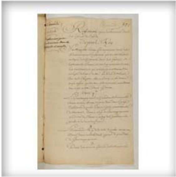
Reglement pour les honneurs dans les Eglises du Canada, 27 avril 1716. FR CAOM COL C11A 106 fol. 377-380