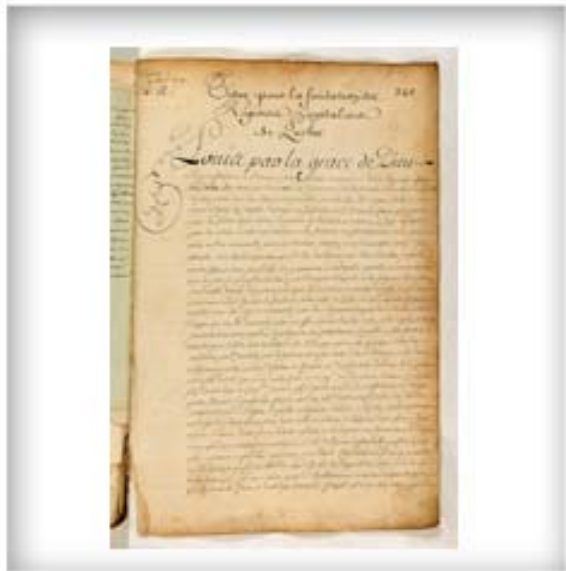
Titre pour la fondation des religieuses hospitalières de Québec, avril 1639 [copie du 14 octobre 1727]. FR CAOM COL F3 12 fol. 346-347vo