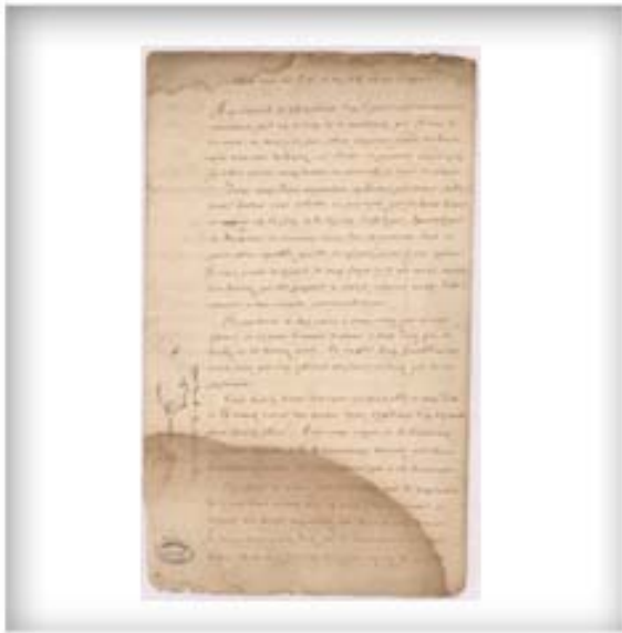
Testament de Samuel de Champlain, 17 novembre 1635. FR CHAN LXII 138 Rés 282

Dans le testament transparaissent l'importance de la religion et les préoccupations face à la vie éternelle. Tout comme Champlain, fondateur de Québec, ou Frontenac, gouverneur de la Nouvelle-France au XVII e siècle, la très grande majorité des testateurs font des legs pour des prières, des messes et des bonnes œuvres.