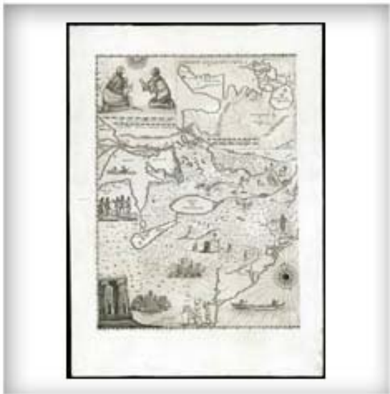
Novae Franciae Accurata Delineatio , carte du jésuite François-Joseph Bressani représentant les missions huronnes et le martyre des missionnaires aux mains des Iroquois, 1657.