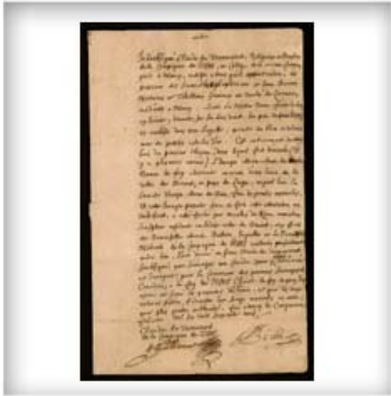
Déclaration du jésuite Claude de Veroncourt sur la statue de la Sainte Vierge dans la chapelle de la bourgade des Hurons près de Québec, 5 février 1669. CA ANC MG18-E18

Autant en France qu'en Nouvelle-France, on attribue à la Vierge et aux saints des pouvoirs miraculeux. Par l'intermédiaire d'images ou d'objets religieux les incarnant, telles les statues et les reliques, les fidèles leur vouent une dévotion particulière. Ils leur demandent d'intervenir pour la guérison d'une maladie, la disparition d'un fléau ou les remercient d'une grâce obtenue.