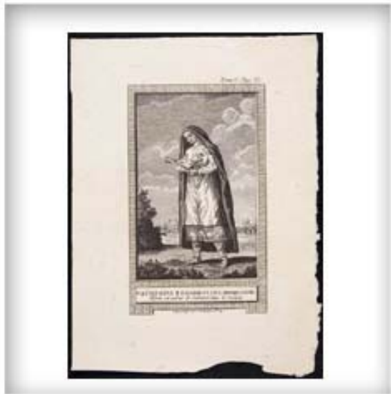
Catherine Tegahkoutta, iroquoise morte en odeur de sainteté dans le Canada (1656-1680), s.d.