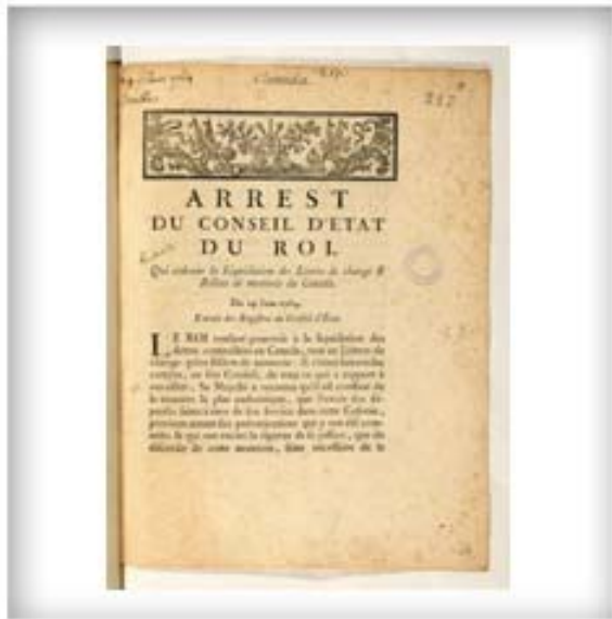
Arrest du Conseil d'État du roi qui ordonne la liquidation des lettres de change et billets de monnaie du Canada, 29 juin 1764.