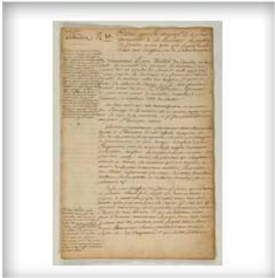
Essai sur les moyens de transporter à la Louisiane la peuplade du Canada en cas qu'on prit le parti de le céder aux Anglois ou de l'abandonner, décembre 1758. FR CAOM COL F4 22 fol. p.1-40