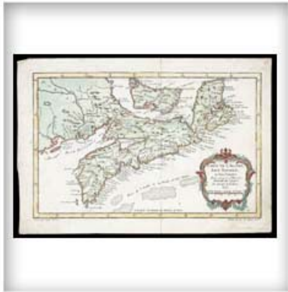
Carte de l'Acadie, Isle Royale et Bois Voisins pour servir à l'histoire générale des voyages, 1757. CA ANC NMC-114

L'Acadie est revendiquée par la France, qui l'a reconnue et occupée périodiquement depuis 1524, à la suite de l'exploration par Giovanni da Verrazzano. Les Anglais considèrent aussi que ces terres leur reviennent depuis la charte du roi Jacques 1 er en 1606, octroyant à la compagnie de la Virginie un territoire allant jusqu'au 45 e parallèle, comprenant ainsi la baie Française et Port-Royal. L'absence de frontières nettes est la cause de conflits incessants entre la France et l'Angleterre ainsi que de heurts multiples entre les colons français et leurs voisins de la Nouvelle-Angleterre. Ni le traité d'Utrecht (1713) ni celui d'Aix-la-Chapelle (1748) n'arrive à déterminer plus précisément les limites de l'Acadie. La France et l'Angleterre étudient la question dans les années 1750, mais la guerre seule mettra fin aux discussions.