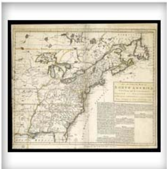
An accurate map of North America describing and distinguishing the British and French Dominions on this great continent according to the definitive treaty concluded at Paris 10th February 1763, [Carte exacte de l'Amérique du Nord, décrivant et distinguant les territoires britanniques et français de cet immense continent, tels que définis par le traité signé à Paris, le 10 février 1763], 1763. CA ANC NMC-6666