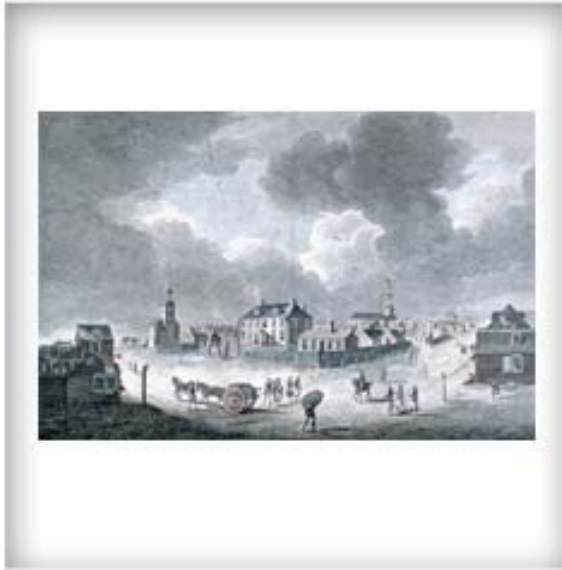
The Governor's House and St. Mather's Meeting House, Halifax (Nova Scotia), [La demeure du gouverneur et la St. Mather's Meeting House, Halifax, (Nouvelle-Écosse)], 1764.