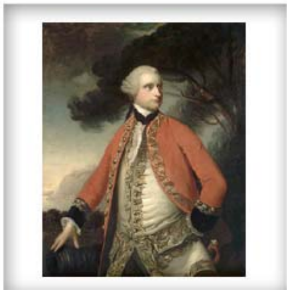
Portrait de James Murray, vers 1770. CA ANC C-2834