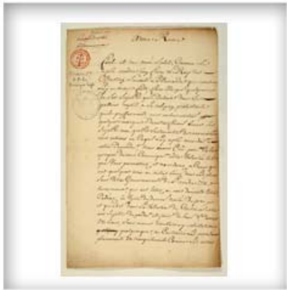
Édit de la reine Anne d'Angleterre qui accorde aux habitants de l'Acadie la possibilité de jouir de leurs terres et de leurs biens, 23 juin 1713. FR CAOM 3DFC 1 pièce 27