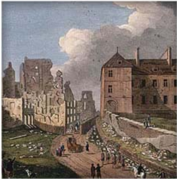
Vue de la maison de l'évêque et des ruines, gravure de Richard Short, 1761 CA ANC C-000350