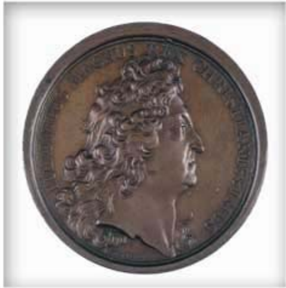
Médaille commémorant le traité d'Utrecht, 1713. CA ANC C-14900 et C-14901