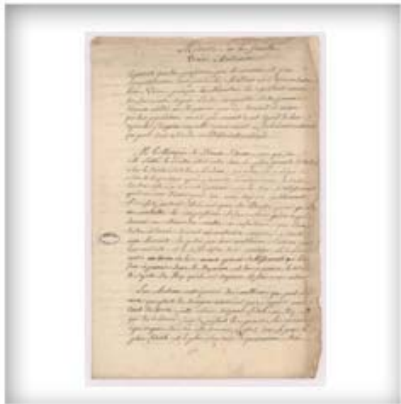
Mémoire sur les familles vraies Acadiennes et projet d'établissement au Poitou, vers 1773. FR CHAN H1 1499/2 606