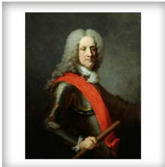
Portrait présumé de Charles de Beauharnois de la Boische, marquis de Beauharnois, gouverneur de la Nouvelle-France entre 1726 et 1747, huile sur toile, vers 1748.