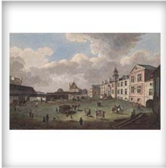
Vue du palais de l'intendant , par Richard Short, 1761. CA ANC C-360