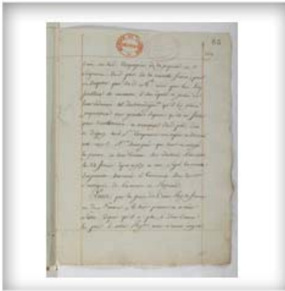
Déclaration du roi qui reprend possession de la Nouvelle-France, mars 1663. FR CAOM COL C11A 2 fol. 5-7

Comme la Compagnie n'est plus en mesure de soutenir et de défendre la colonie peu peuplée et menacée par les incursions iroquoises, le roi en reprend possession afin d'assurer son développement et sa sécurité. Il y établit alors un cadre administratif semblable à celui des provinces françaises comprenant un gouverneur général, un intendant et un Conseil souverain.