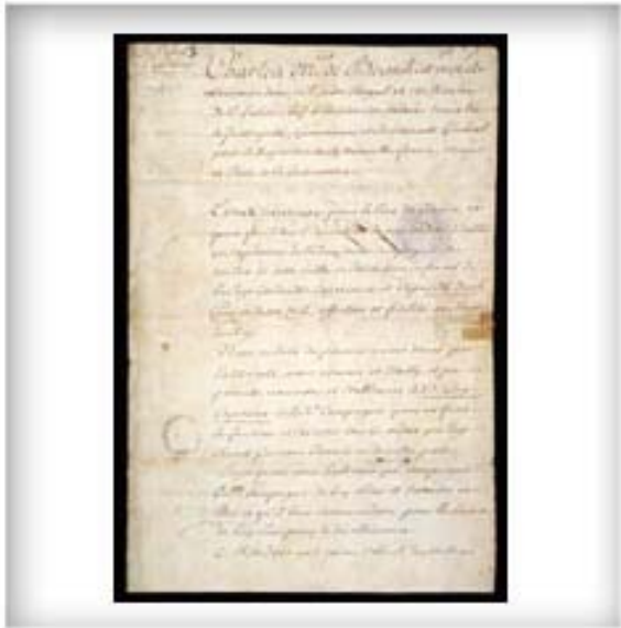
Commission de capitaine de la douzième compagnie de milice de Montréal accordée à Pierre Guy par Charles de Beauharnois de la Boische, gouverneur de la Nouvelle-France, 30 juillet 1743. CA ANC MG23-GIII28