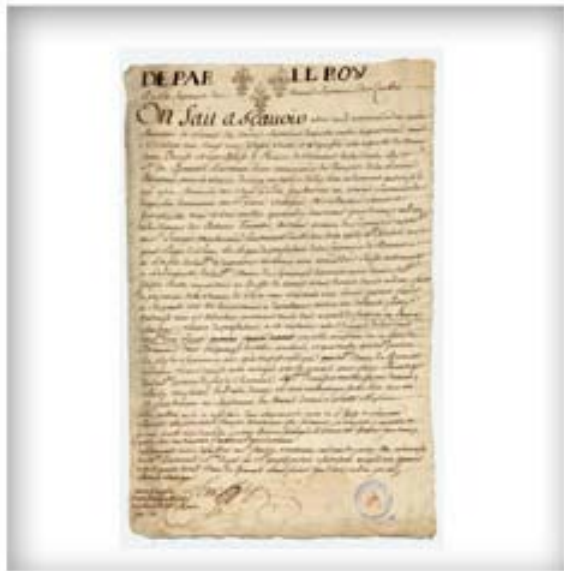
Avis public de l'huissier Clesse annonçant la vente aux enchères de la seigneurie de François Bonhomme, 8 mai 1729. CA ANQ-Q TP1 S37/3 Fonds Conseil supérieur de Québec Série Registres divers et pièces détachées pièce 105