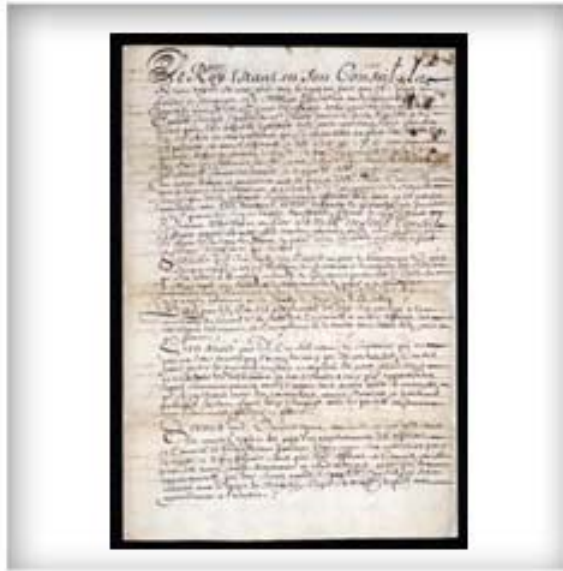
Règlement pour remédier à certains abus qui sont commis au Canada et établissant un conseil composé du gouverneur général, du gouverneur de Montréal et du supérieur des jésuites, 27 mars 1647. CA ANC MG18-H65