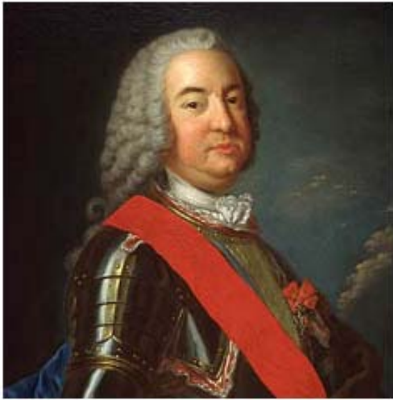
Portrait de Pierre de Rigaud de Vaudreuil de Cavagnal, marquis de Vaudreuil, dernier gouverneur de la Nouvelle-France, 1753-1755.