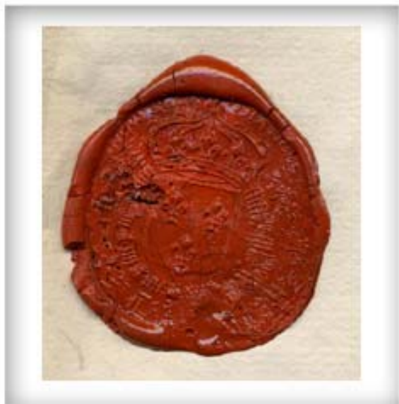
Sceau du Conseil souverain, 30 janvier 1742. CA ANQ-Q TL5/6 Collection Pièces judiciaires et notariales dossier 1280